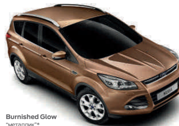
Burnished Glow "металлик"*