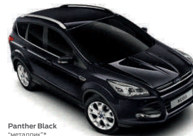
Panther Black "металлик"*