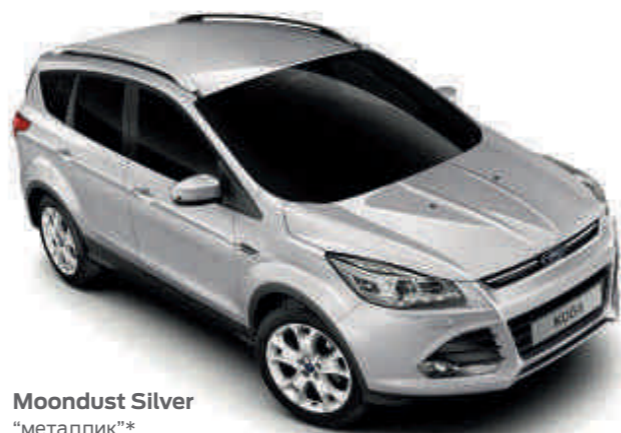
Moondust Silver "металлик"*