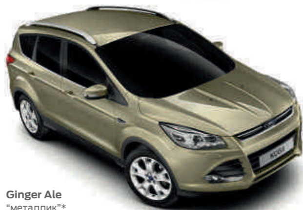
Ginger Ale "металлик"*