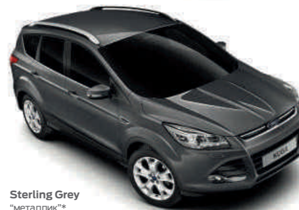
Sterling Grey "металлик"*