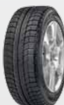
Latitude X-Ice 2