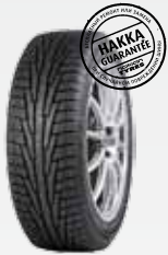
Ford Focus II 195/65R15 Hakkapeliitta R 5 540 руб.