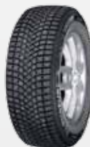
Latitude X-Ice north 2