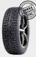
Ford Mondeo 215/55R16 Hakkapeliitta 7 9 270 руб.