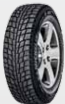
X-Ice north 2