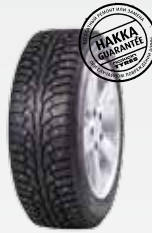
Ford Focus III 215/55R16 Hakkapeliitta 5 8 360 руб.