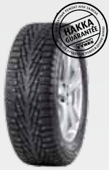
Ford Explorer 245/60R18 Hakkapeliitta 7 SUV 14 170 руб.